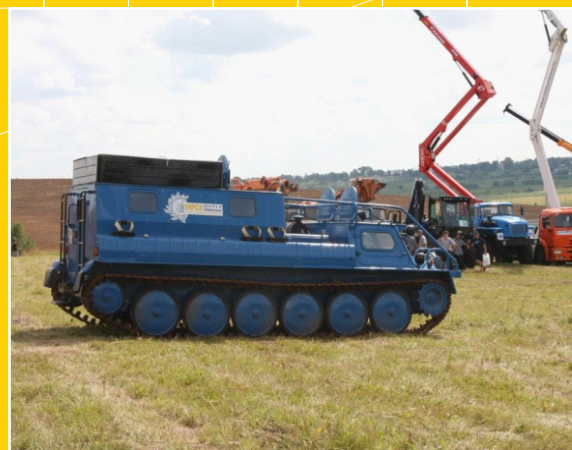
Вездеход ГАЗ 34039