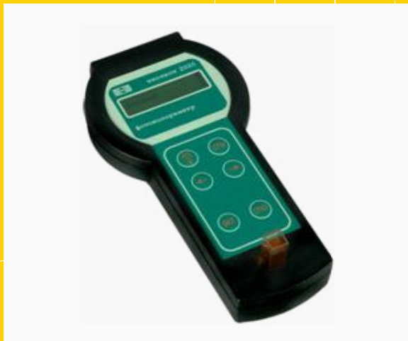
Микропроцессорные устройства для определения параметров сети