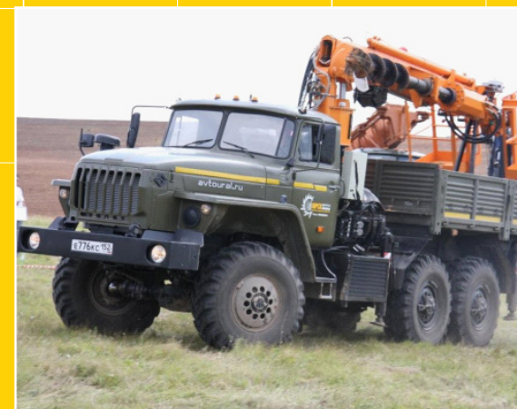
МКМ 200 на шасси УРАЛ