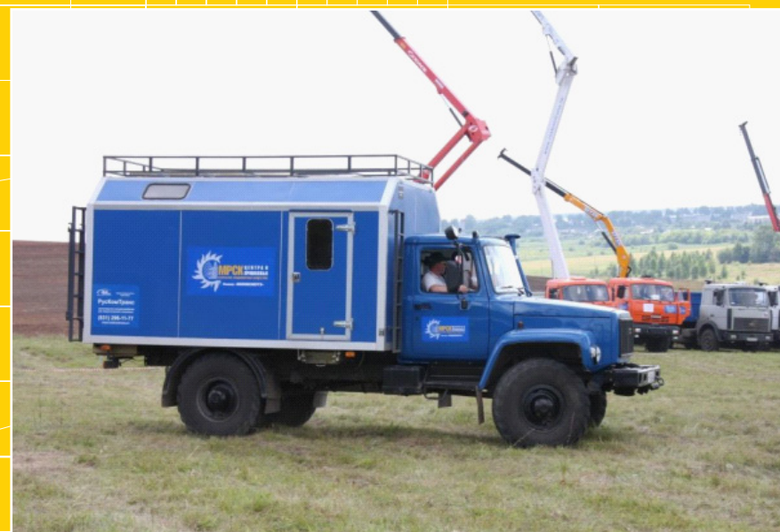
Бригадный автомобиль САДКО