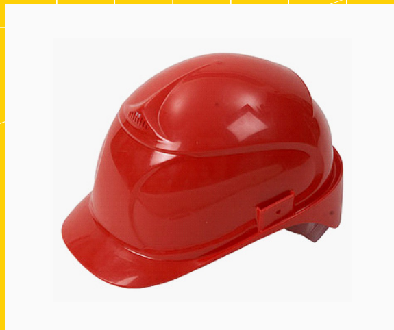
Каски со встроенным индикатором напряжения